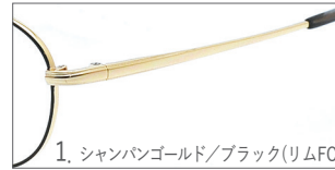
1. シャンパンゴールド/ブラック(リムFC)