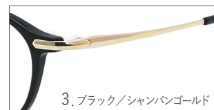
3. ブラック/シャンパンゴールド