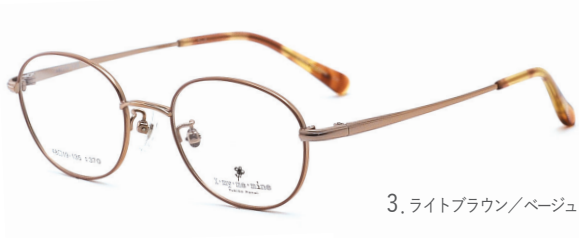
3. ライトブラウン/ベージュピンク(リムFC)