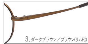
3. ダークブラウン/ブラウン(リムFC)