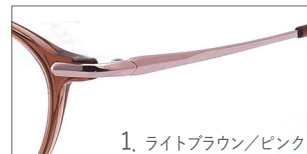
1. ライトブラウン/ピンク