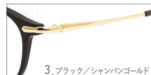
3. ブラック/シャンパンゴールド