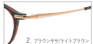
2. ブラウンササ/ライトブラウン