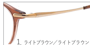
1. ライトブラウン/ライトブラウン