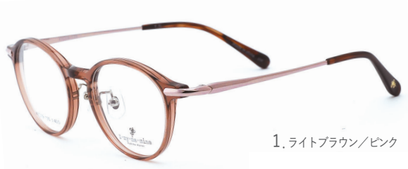
1. ライトブラウン/ピンク

素材 / F:アセテート T:チタン サイズ / 48□19 -135 Φ40.0