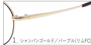
1. シャンパンゴールド/パープル(リムFC)