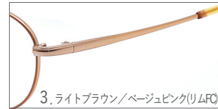
3. ライトブラウン/ベージュピンク(リムFC)