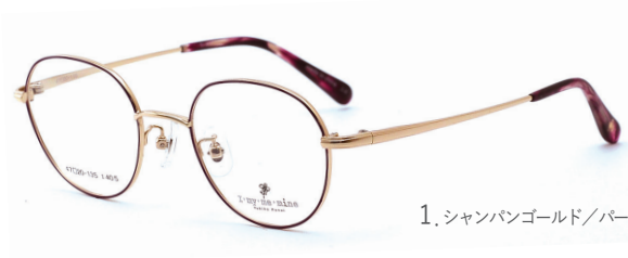
1. シャンパンゴールド/パープル(リムFC)