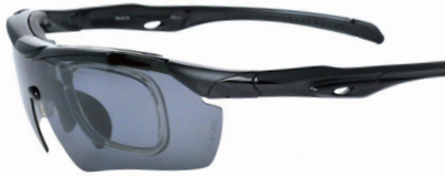
(偏光スモークレンズ装着例)