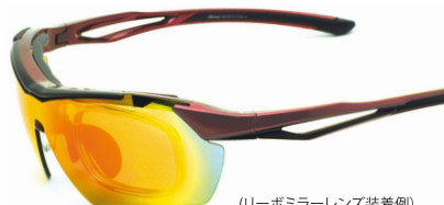
(リーボミラーレンズ装着例)