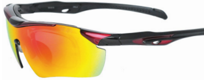
(リーボミラーレンズ装着例)