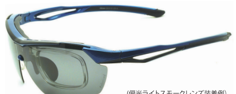
(偏光ライトスモークレンズ装着例)