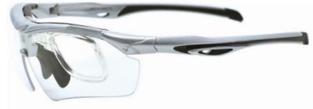
(クリアレンズ装着例)