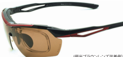
(偏光ブラウンレンズ装着例)